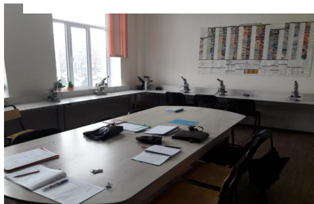
Лаборатория № 3. «Петрография, петрология» и «Петрография, Литология», “Лабораторные методы исследования руд”. Аудитория №16