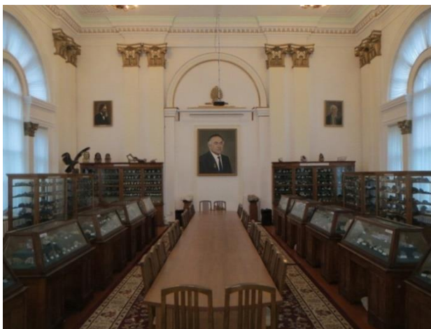
Лаборатория № 1. Геологический музей. Аудитория №21а