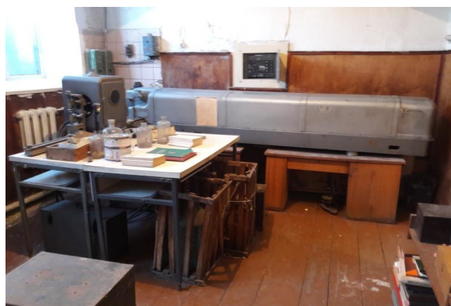
Лаборатория № 6. «Лаборатория спектрального анализа». Аудитория №39