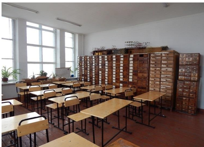
Лаборатория № 4. «Кристаллография, минералогия» и «Общая геология». Аудитория №19