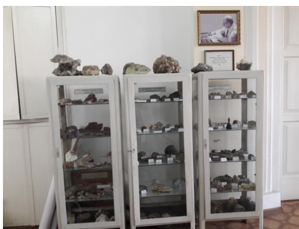
Лаборатория № 2. Месторождения полезных ископаемых Тянь-Шаня. Аудитория №21