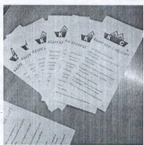
Рис.2 - буклеты о Кыргызстандарте с требованиями при приеме на работу