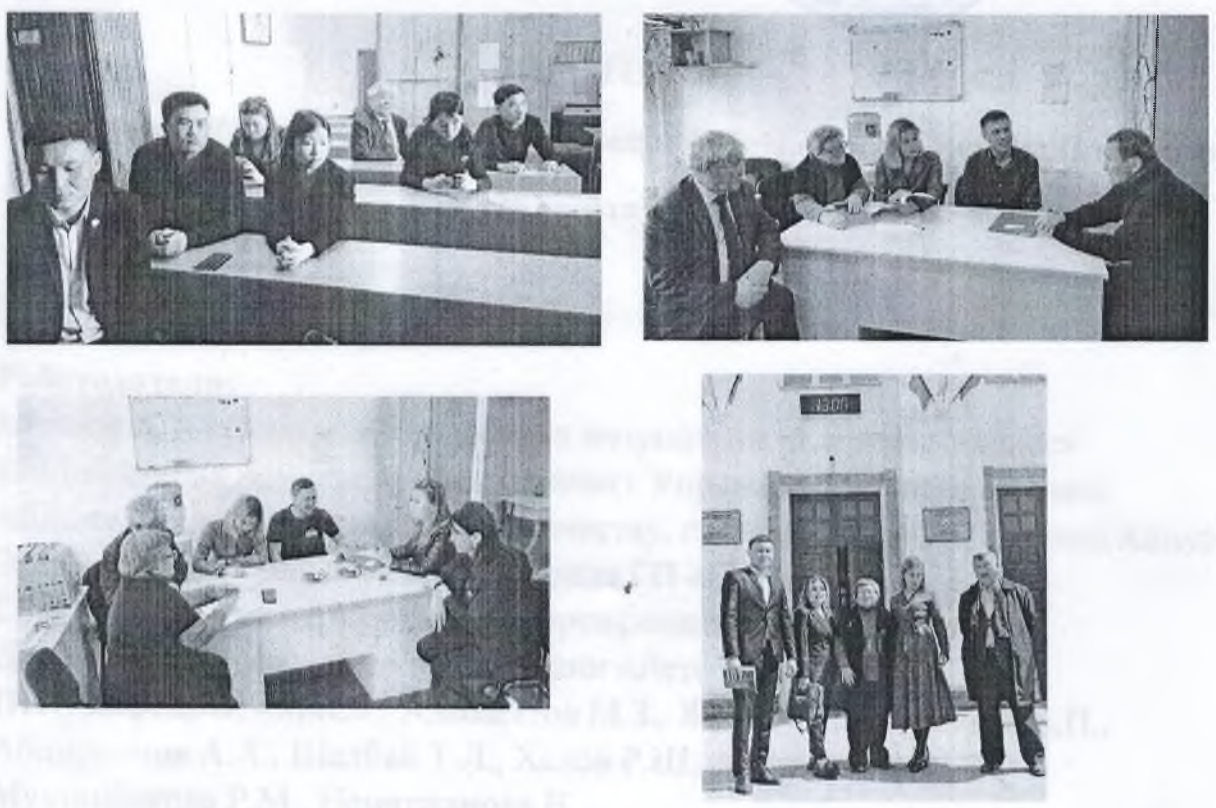
Рис.1 – Обсуждение актуальных вопросов на заседании круглого стола (28 марта 2023г.)