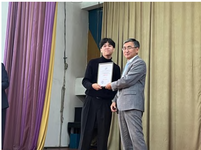
Фото 1 вручение благодарности старосте за участие группы в дне кыргызского языка