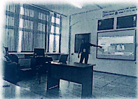
Преподаватели и студенты во время семинара