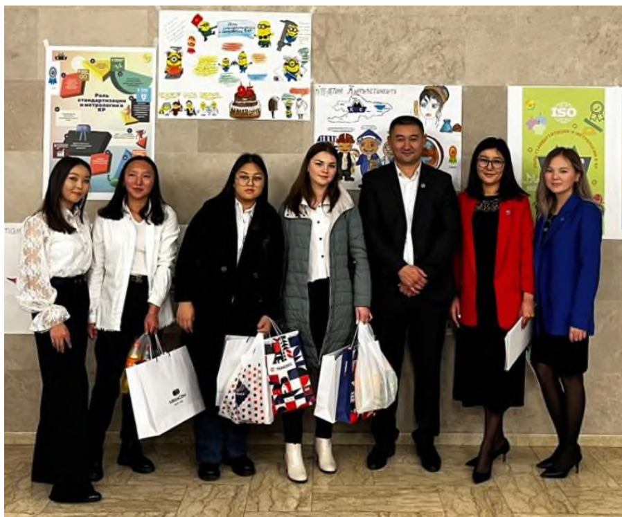
Рисунок 11. Староста группы ССМ-19, награжденная за лучший постер по стандартизации.

Группа ССМ-1-19 также награждена дипломом 1 степени среди студентов ВУЗов за лучший постер по стандартизации