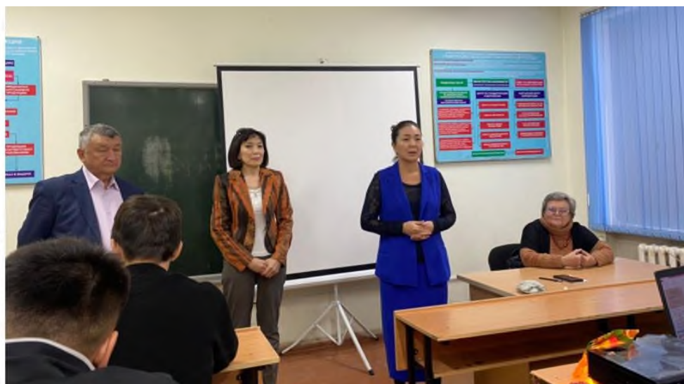
Рис.8 Сотрудники Кыргызстандарта с выступлением о современном состоянии работ по метрологии в Кыргызстане.

Сотрудники кафедры МиС и представители Кыргызстандарта обсудили актуальные вопросы по стандартизации, метрологии и управлению качеством с целью повышения качества подготовки специалистов. (Рис.9)