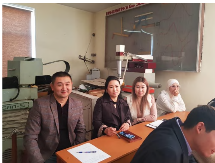
Рисунок 2 – Представители Кыргызстандарта, ВШЭиБ, кафедры МиС