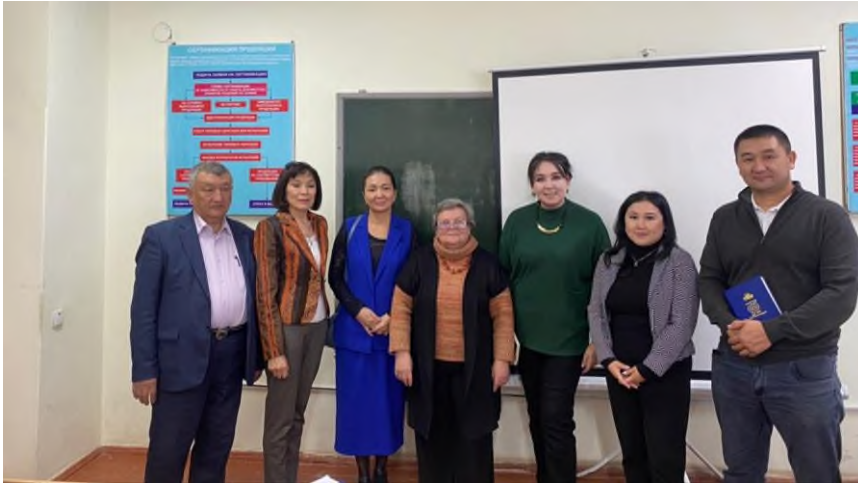
Рисунок 9 Сотрудники кафедры и специалисты Кыргызстандарта.

24 Октября знаменательная дата для всех метрологов и стандартизаторов Кыргызской Республики – 95 лет КЫРГЫЗСТАНДАРТУ!!!