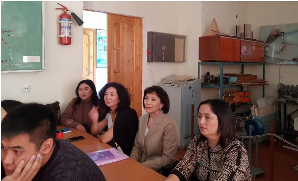
Рисунок 3. Представители Кыргызстандарта на лекции проф. Алмаматова М.З.

2). 13.10.2022 г. ст. преп. Халов Р.Ш. провел открытый урок на тему: «Статистические инструменты управление качеством», участвовали преподаватели каф. МиС, студенты с 1-4 курса ВШЭИБ и Технологического института и сотрудники Кыргызстандарта.