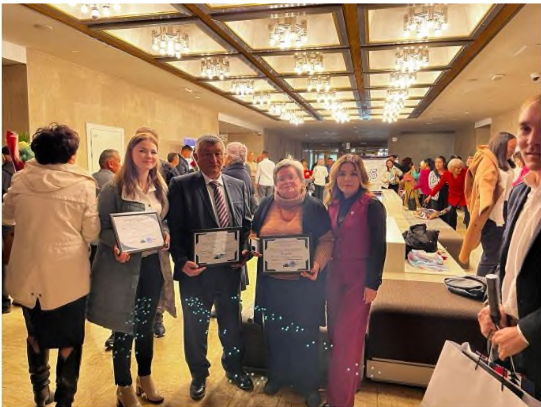
Рисунок 10. В Историческом музее на форуме профессионального праздника

Кафедра «Метрология и стандартизация» также участвовала в юбилейных мероприятиях Кыргызстандарта.