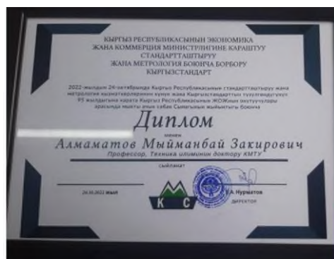
Рисунок 13 Диплом от Кыргызстандарта Алматову М.З.

Дипломами и ценными подарками также награждены ио доцента каф. МиС Шалабай Т.Л. и старший преподаватель Халов Р.Ш.