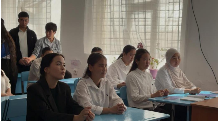
Фото отчет города Манас 02.04.26.