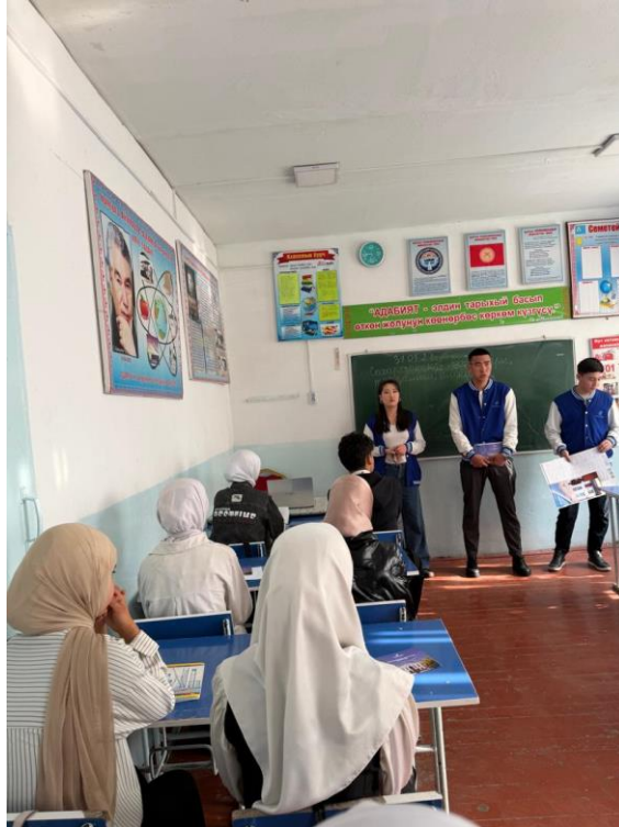
Фото отчет Сузакского района Село Сузак 01.04.26.