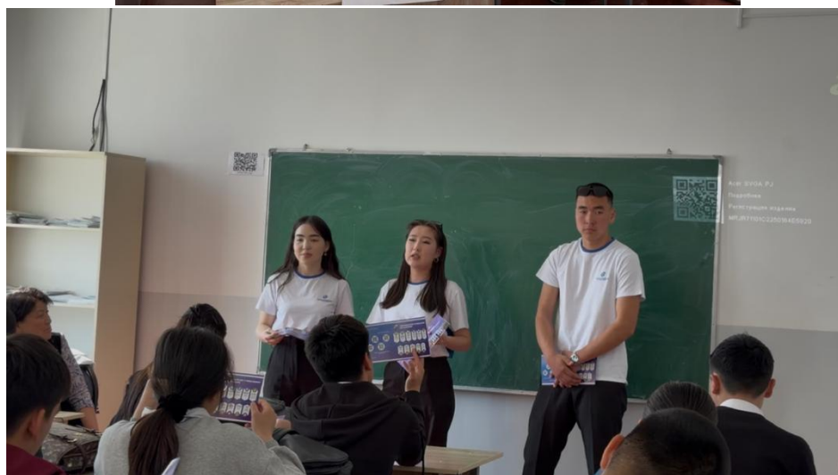
Фото отчет города Манас 03.04.26.