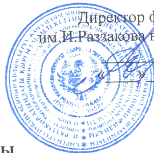
График работы Государственной аттестационной комиссии по итоговой аттестации выпускников в филиале КГТУ им. И. Раззакова в г. Кызыл-Кия Баткенской области обучающихся по кредитной системе обучения, очной, заочной форме обучения с применением ДОТ на 2024-2025 учебный год