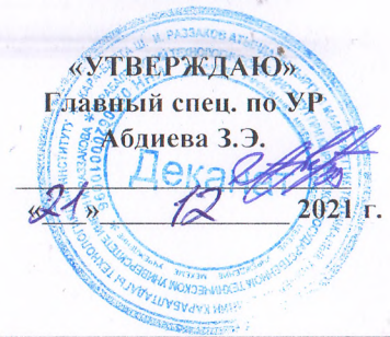
ГРАФИК СДАЧИ ЭКЗАМЕНОВ ГРУППА ЭЭ-1-20