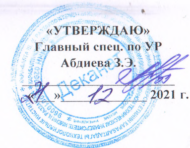
ГРАФИК СДАЧИ ЭКЗАМЕНОВ ГРУППА УТС-1-20