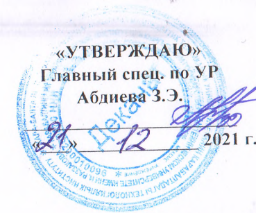
ГРАФИК СДАЧИ ЭКЗАМЕНОВ ГРУППА НФД-1-20