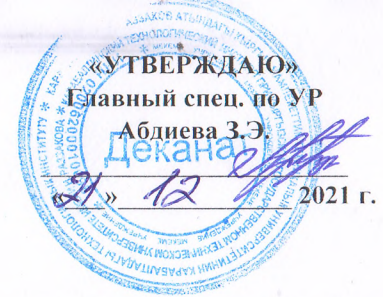
ГРАФИК СДАЧИ ЭКЗАМЕНОВ ГРУППА КОМ-1-20