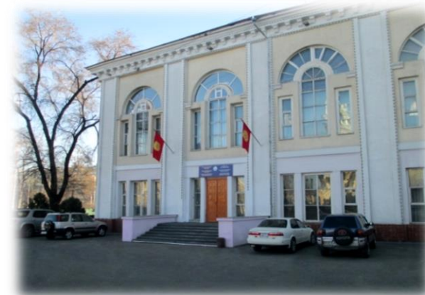
Учебный корпус №2

Информация для будущих маркшейдеров! Добро пожаловать!