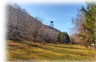
Учебные полигоны: Кегети и Чункурчак