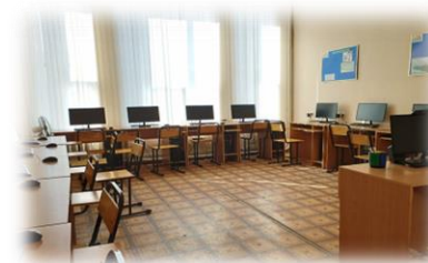
№3 аудитория MICROMINE

Кафедра имеет учебные приборы и инструменты, современный компьютер, специальную литературу, методические пособия доступные всем. Компьютер оснащен передовыми технологическими программами для решения различных маркшейдерских и геодезических задач. Особенно нужно отметить программное обеспечение, MICROMINE, AvtoCAD переданное разработчиками для обучения студентов нашего университета.