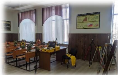
№25 аудитория Маркшейдерское дело

Лабораторные занятия проводятся согласно учебного плана в специализированной аудитории №25 и на полигоне (занятия на приборах).