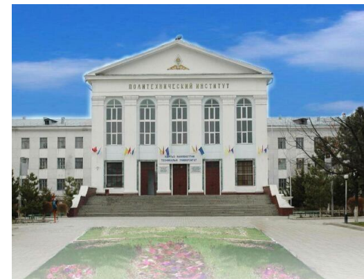
Кафедра «Метрология и стандартизация»

КЫРГЫЗСКИЙ ГОСУДАРСТВЕННЫЙ ТЕХНИЧЕСКИЙ УНИВЕРСИТЕТ ИМ. И. РАЗЗАКОВА ВЫСШАЯ ШКОЛА ЭКОНОМИКИ И БИЗНЕСА