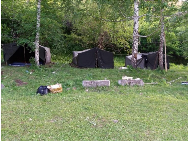
Полевое жилье студентов.