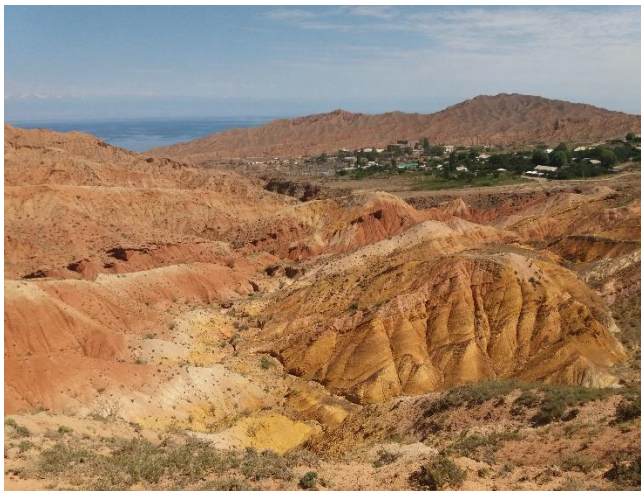
Разрез Аксайской свиты.