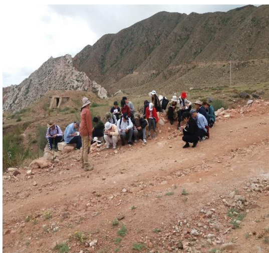
Рекогностировочный (ознакомительный) маршрут.