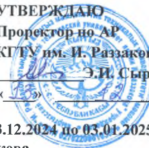
График экзаменационной сессии на осенний семестр за 2024-2025 учебный год с 23.12.2024 по 03.01.2025 г. гр. ЭС 11-1-23 Политехнического колледжа КГТУ им. И. Раззакова