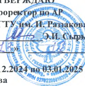
График экзаменационной сессии на осенний семестр за 2024-2025 учебный год с 23.12.2024 по 03.01.2025 г. гр. ЭС9-2-22 Политехнического колледжа КГТУ им. И. Разакова