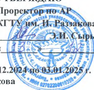
График экзаменационной сессии на осенний семестр за 2024-2025 учебный год с 23.12.2024 по 03.01.2025 г. гр. Т0Р9-1-22 Политехнического колледжа КГТУ им. И. Раззакова

Примечание: 1. Итоговый контроль в Online режиме только для студентов по индивидуальному графику. 2. Болеющих студентов отметить в I ведомости.