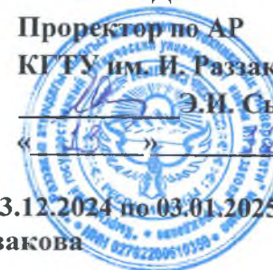
График экзаменационной сессии на осенний семестр за 2024-2025 учебный год с 23.12.2024 по 03.01.2025 г. гр. Т0Р11-1-23 Политехнического колледжа КГТУ им. И. Раззакова