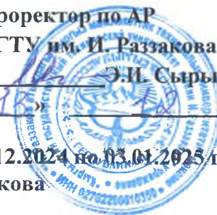
График экзаменационной сессии на осенний семестр за 2024-2025 учебный год с 23.12.2024 по 03.01.2025 г. гр. ОПУТ 11-1-23 Политехнического колледжа КГТУ им. И. Раззакова

Примечание: 1. Итоговый контроль в Online режиме только для студентов по индивидуальному графику. 2. Болеющих студентов отметить в I ведомости.