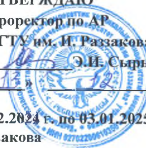
График экзаменационной сессии на осенний семестр за 2024-2025 учебный год с 23.12.2024 г. по 03.01.2025 г. гр. КМТШИ 11-1-23 Политехнического колледжа КГТУ им. И. Раззакова