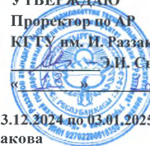
График экзаменационной сессии на осенний семестр за 2024-2025 учебный год с 23.12.2024 по 03.01.2025 г. гр. ТОР9-2-22 Политехнического колледжа КГТУ им. И. Раззакова