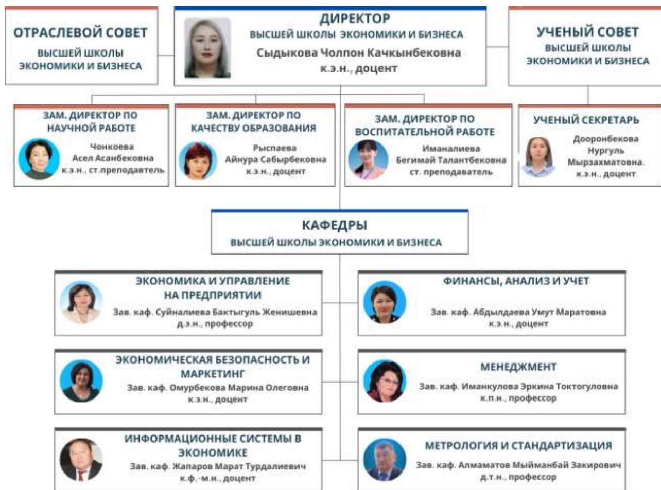
Рис. 2.1. Структура Высшей школы экономики и бизнеса

В структуру ВШЭБ входят директор ВШЭБ, Ученый и отраслевой совет ВШЭБ, заместители директора по качеству образования, научной и воспитательной работе и шесть выпускающих кафедр (см. рисунок 2.1).