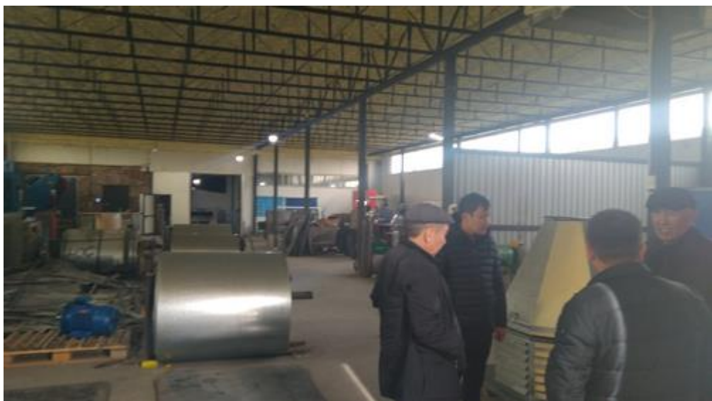
На производстве ОсОО МегаВентс