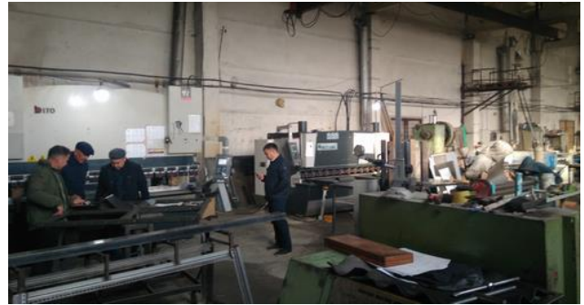
На производстве ОсОО Деса инжиниринг