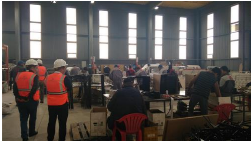
На производстве ОсОО Маткасымов