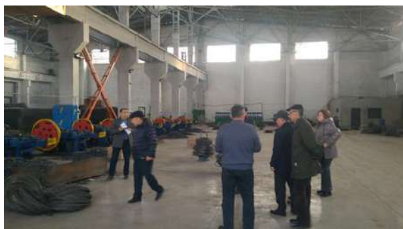
На производстве ОсОО «Кыргызтемир»