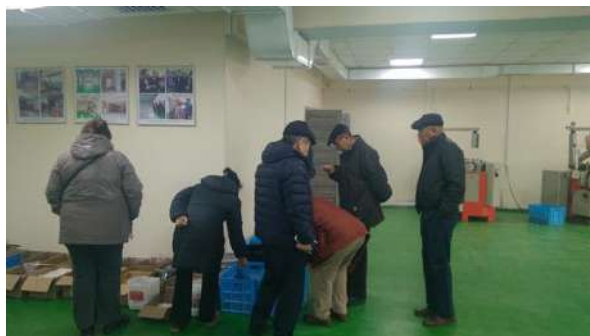
На производстве ОсОО «Кыргызтопчу»