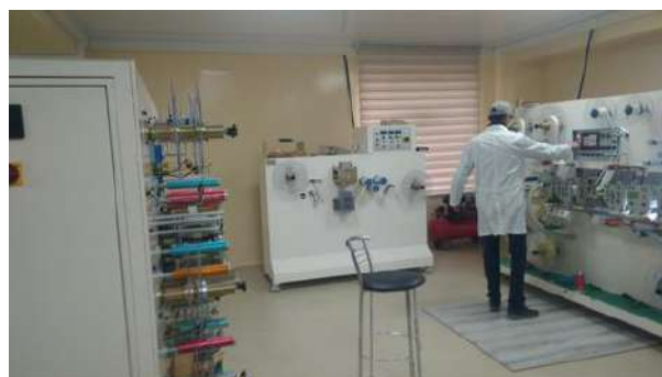
На производстве ОсОО «ВК Medicare»