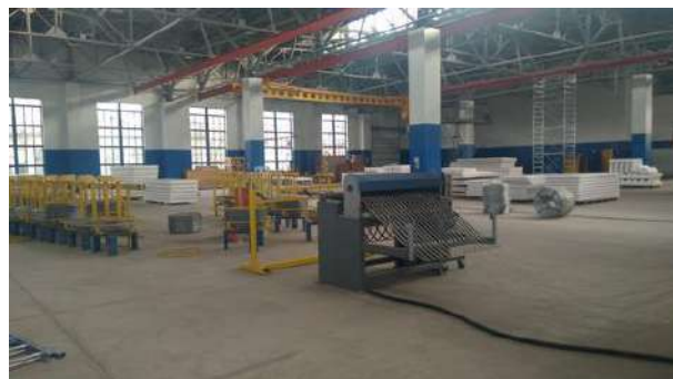
На производстве ОсОО «Кыргыз бетон курулуш»