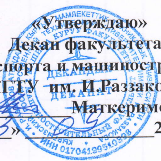
ГРАФИК взаимопосещения занятий ППС по кафедре «Автомобильный транспорт» на 2019-2020 уч. год.